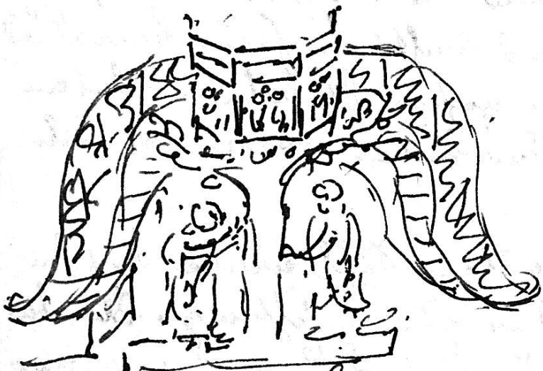
Christus der der kleinen